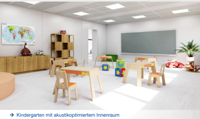
→ Kindergarten mit akustikoptimiertem Innenraum