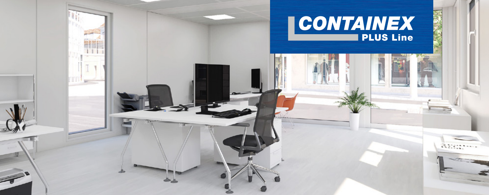
→ Attraktiver Büorinnenraum mit vielen Ausstattungsvarianten