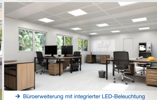
→ Büroerweiterung mit integrierter LED-Beleuchtung