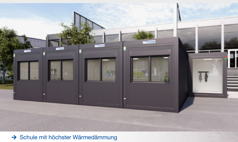
→ Schule mit höchster Wärmedämmung